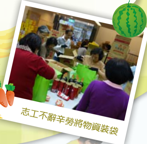
志工不辭辛勞將物資裝袋