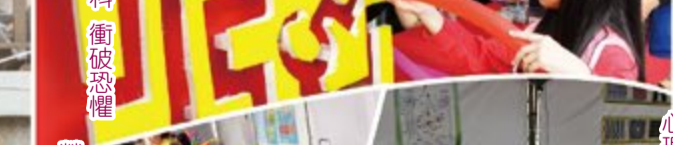
心理科 自律神經檢測