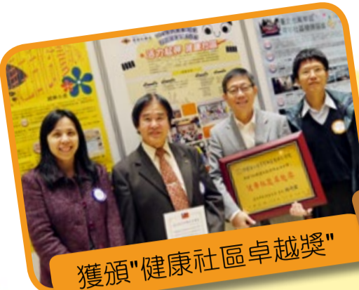
獲頒"健康社區卓越獎"