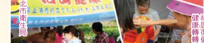
社區復健中心 健康轉轉樂