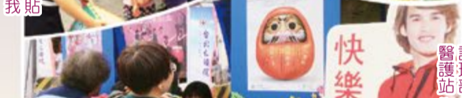
護理部 醫護站 衛教宣導