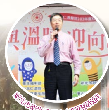
新北市衛生局 副局長致詞