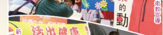
新北市衛生局 衛教宣導