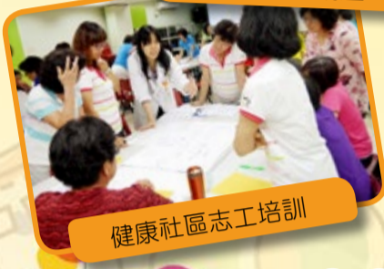
健康社區志工培訓