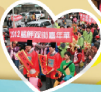
仁濟醫院醫務部財神爺沿途向民眾與店家拜年祈福。