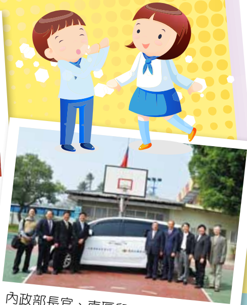
內政部長官、南區兒童之家主任與仁濟院院長、董事會秘書等與捐贈座車合影