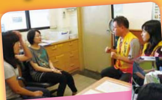
由本院社工員飾演案主陪同 志工家訪演練