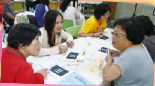
志工以兩人一組演練會談技巧

台北仁濟院弱勢家庭食物銀行扶助計畫，自100年開辦至今，已經進入第3年，共募集近70位熱忱愛心的民眾擔任訪視志工，投入台北市萬華、大同、內湖區及新北市板橋區等四區的弱勢案家訪視。志工夥伴平常的任務包括案家關懷、拜訪，物資募集及整理、發送食物，他們的服務品質良好且聲譽卓著，並積極地參與在職訓練與聯繫會報以提升服務品質和團隊精神。