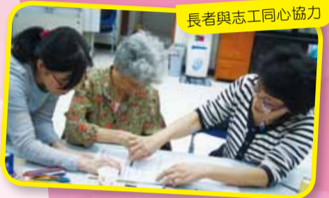
長者與志工同心協力