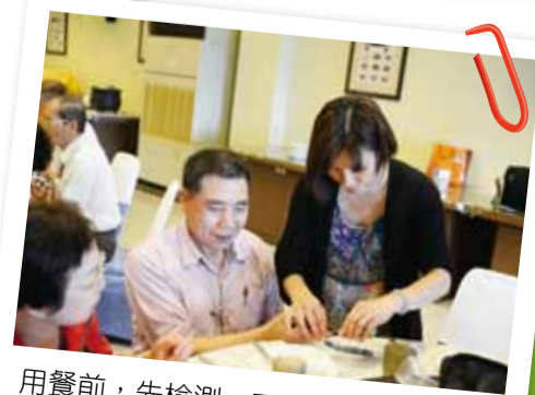
用餐前，先檢測一下血糖