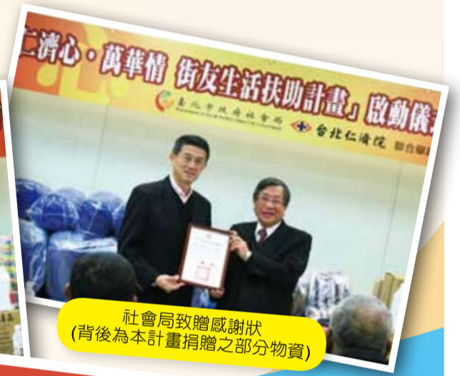
社會局致贈感謝狀 (背後為本計畫捐贈之部分物資)