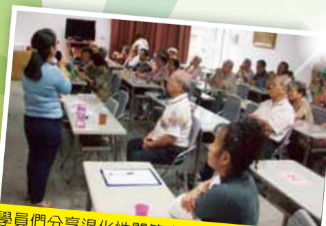
與學員們分享退化性關節炎之護理與睡眠障礙

走入社區領域環結能發揮醫療宣導之成效；也能提供協助居民的醫療單位；對於社區何嘗不是一大福音？本院在地緣上屬較偏僻，有這兩次機會實際的和社區居民面對面分享主題；衛教正確的醫療知識，也開啟了居民邁向正確就醫大門的一大步。