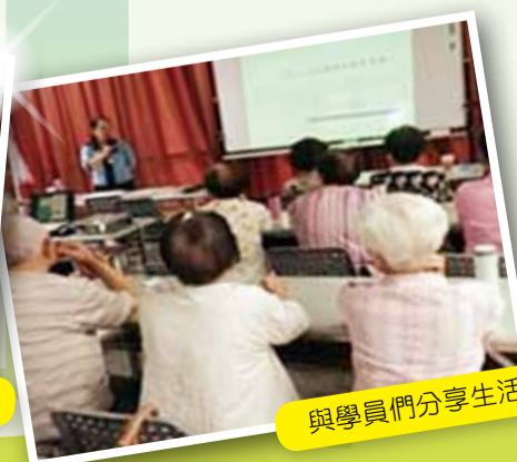
與學員們分享生活舒壓小方法