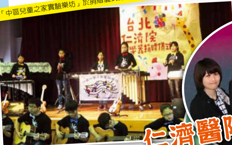
「中區兒童之家實驗樂坊」於捐贈儀式時的精彩演出